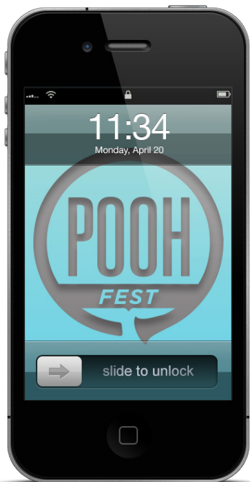
Primjena prijedloga logotipa na: iPhone 4 lock-screen pozadinu.