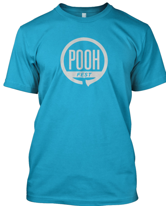
Primjena prijedloga logotipa na: majicu.